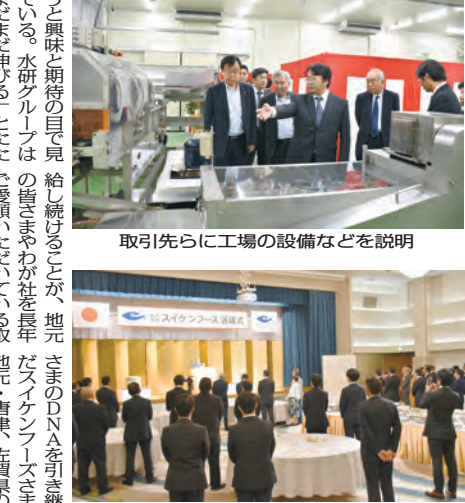
新水産加工場の落成式

【唐津】大阪の水産専門商社、水研（斎藤総一郎社長）の100%子会社「スイケンフーズ」（佐賀県唐津市、南郷善社長）の水産加工工場が20日、同市の唐津水産加工団地内に竣工した。HACCP対応型の工場で、10月から本格的に生産を開始する。20日に市内であった竣工式、落成式には山口祥義県知事、峰達郎唐津市長、唐津水産加工団地協同組合の青木代表理事ら関係者約100人が出席し、完成を祝った。竣工式、落成式の様子とともに、斎藤社長にこれからの水研グループについて話を聞いた。