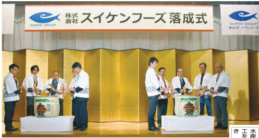
水産加工場の竣工を祝い、開業式が行われた。